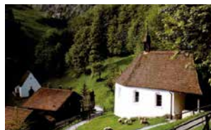
Niklaus v. Flüe lebte hier im Ranft

«O Gott, errette uns vor allen Worten die Schmerzen zufügen und verleihe uns Herzen die berühren. O Allbarmherziger, gib uns die Weisheit, um von der Rechtleitung zu lernen, mit der du alle Propheten gesegnet hast. Wir bitten dich, tröste diejenigen, die in Trauer sind und erleichtere ihren Zustand. Unser Herr, verleihe uns Mitgefühl und Verständnis, so dass wir in Frieden und Gerechtigkeit leben mögen. Hilf uns, die Unterdrückten aufzuhalten, egal ob sie aus unserer Nation, Rasse oder Stamm sind, oder nicht. Gib uns die Kraft, für das Gute aller Menschen zu sorgen. Lass unsere Kinder von unseren Fehlern lernen und für eine sicherere, friedlichere und gerechtere Welt arbeiten. Leite unsere Führer zu weisen und gerechten Entscheidungen. Bewahre uns vor Hass und Intoleranz. Mache uns zu jenen, die sich für das Gerechtige, Gute und Schöne einsetzen. Bei Deiner unermesslichen Barmherzigkeit bitten wir dich. Amin!» (ft/ms)