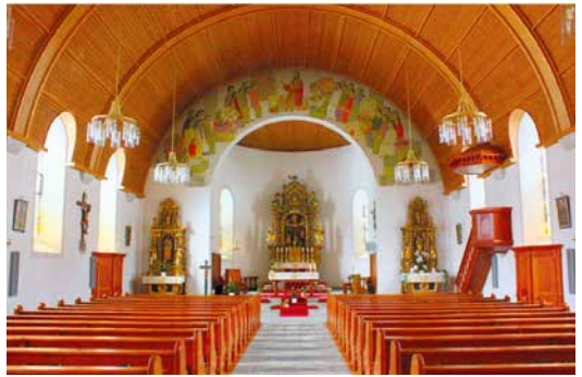
Pfarrkirche St. Barbara in Saas Almagell

Ich war erstaunt und zugleich tief berührt. Tatsächlich hatte Jesus meine Bitte in dieser Weise beantwortet. Er zeigt sich denen, die ihn suchen und für eine Begegnung mit ihm offen sind. Seine Antwort war leise und unaufdringlich – und doch klar und deutlich wahrnehmbar.